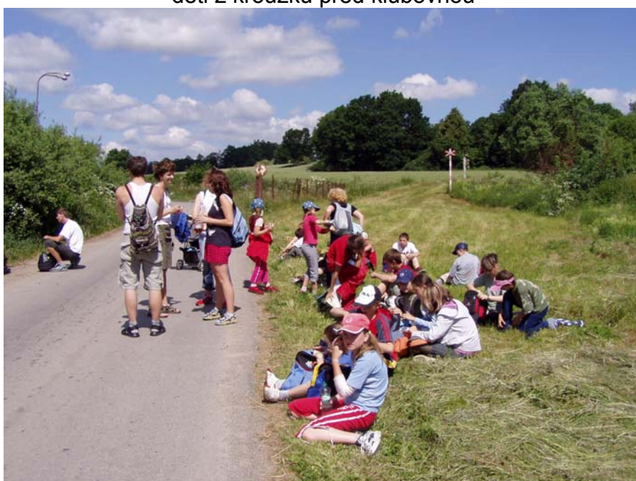
výlet KMOP na Blatensko