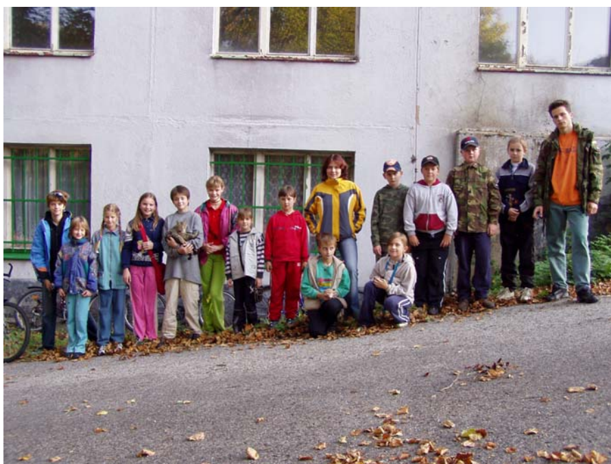
děti z kroužku před klubovnou