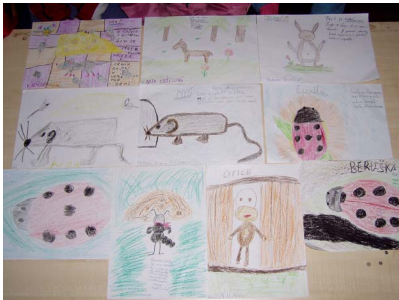
ukázky kreseb dětí